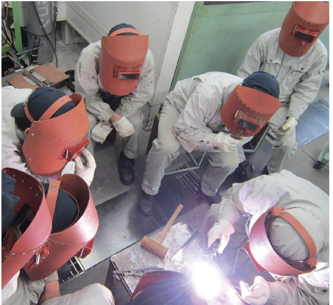
溶接見本実演風景例