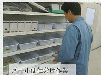
メール便仕分け作業