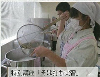
特別講座「そば打ち実習」