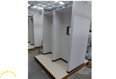
模擬家屋の施工（基礎）