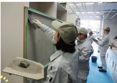
左官・タイル貼り