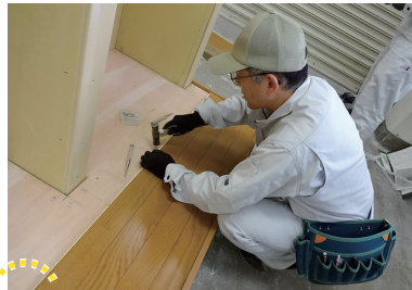
フローリング施工