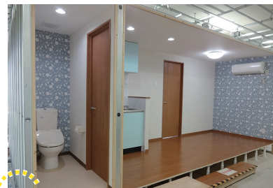
模擬家屋の施工（応用実習）