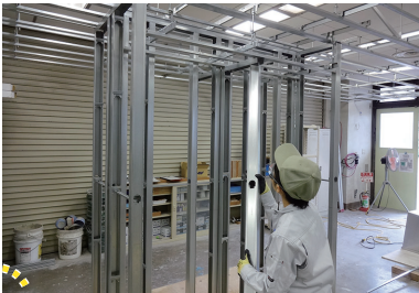
鋼製下地（壁と天井の下地）