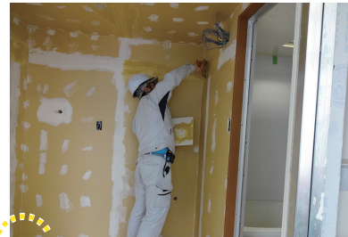
壁の下地処理（パテ処理）