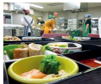
家事支援実習(調理)