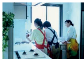
家事支援実習 (キッチン清掃)