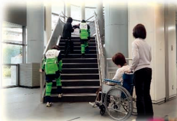
下: 家事支援実習 (ミシン・アイロン)

近年、調理・掃除などの家事代行や介護の知識や技術を必要とする支援の仕事が注目されています。当科は、生活を支えるサービスを提供するために必要な技術を習得することができる科目です。今までに家事と介護の経験がなくても、基礎から学ぶことができます。