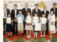
児童画コンテスト表彰式*