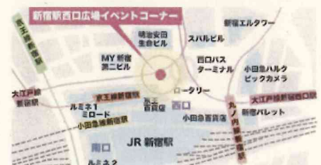
会場案内図 (JR新宿駅西口改札口と同じ階です)