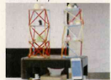
ストローハウスコンテスト*