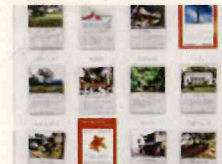
東京の景観・絵葉書展*