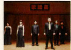
ヴォーカルアンサンブル「歌譜喜」