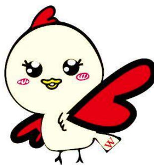
赤羽校イメージキャラクター:あかばねちゃん