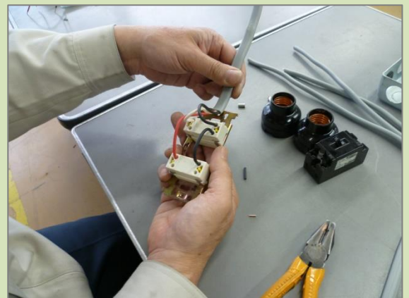
第一種・第二種電気工事士 (実技) の受験対策もできます。