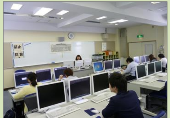
オーダーメイド講習 (CAD 製図) の実施風景です。わかりやすいと好評でした。