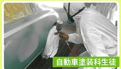
自動車塗装科生徒

実践での作業のコツなどを丁寧に教えて頂いた。プロの職人さんは常に細部まで気を配り、仕事場の整理もなされていて、無駄がなかった。