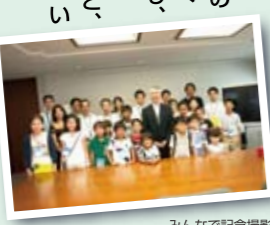
みんなで記念撮影

●実施風景の記録 後日、社内報やホームページなどに掲載するための写真や、記録用映像の撮影もお忘れなく。まんべんなく撮影し、参加者にお渡しすると喜ばれます。ただし、撮影を希望されない参加者への配慮も必要です。参加者の方にアンケートを書いていただくなど、実施状況を報告するための資料収集もおこないます。