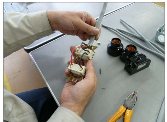
第一種・第二種電気工事士(実技)の受験対策もできます。