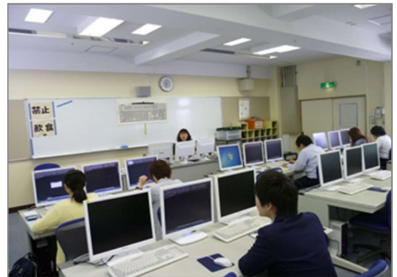
オーダーメイド講習（CAD 製図）の実施