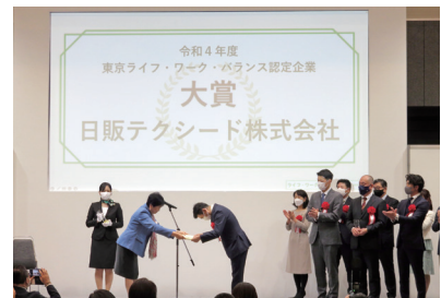
小池都知事による認定状授与の様子

このほか、ステージでは基調講演や男性育業フォーラム、男性の育児と仕事の両立、多様な働き方、女性の活躍に関するパネルディスカッションが開催されました。また、認定企業によるブース出展や交流会、働き方改革に役立つツールなどの展示も実施され、会場は多くの来場者で賑わいました。