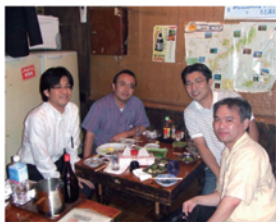
沖縄でお客様との再会