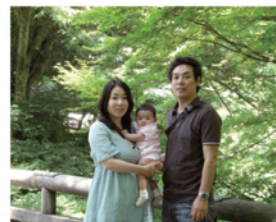
家族で金沢へ温泉旅行