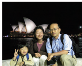
家族でオーストラリアへ