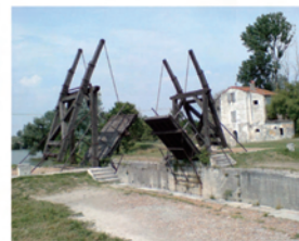
フランス・アルルの「跳ね橋」