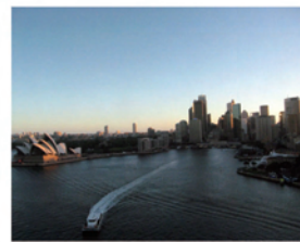
シドニーのサンセット