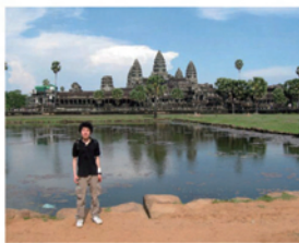
アンコールワットにて