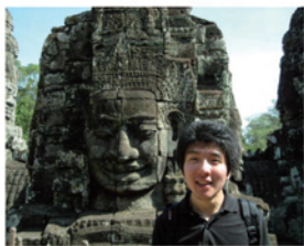
カンボジアへ一人旅