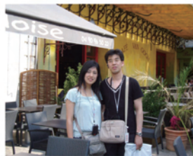
新婚旅行でフランスへ